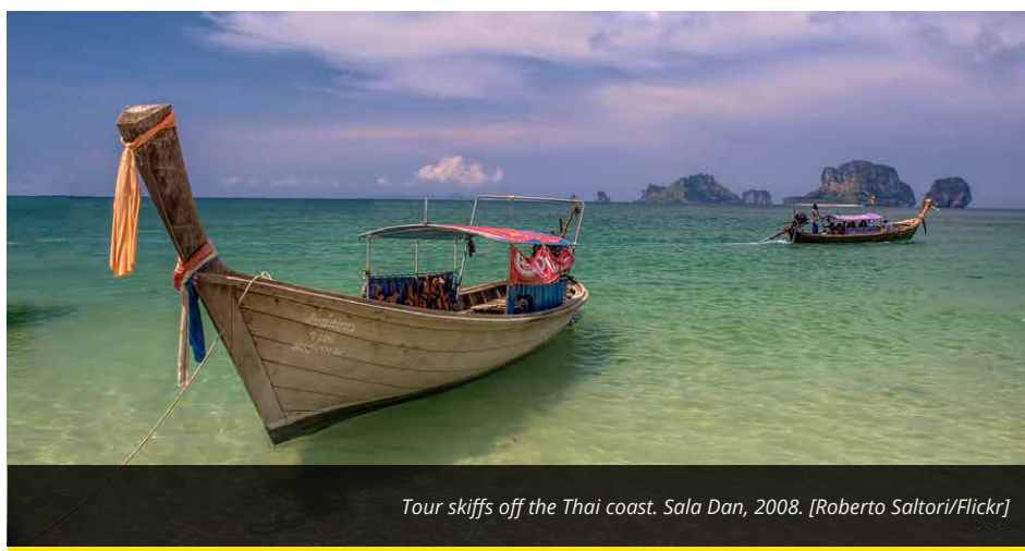
Tour skiffs off the Thai coast. Sala Dan, 2008.

The European Commission stands poised to make a decision any day now on banning all Thai fish imports to the EU, an industry worth some $3bln in 2014. Widespread allegations of labour abuses in Thailand’s fruit processing and fishing industries – two key sectors – have soiled the country’s international reputation.