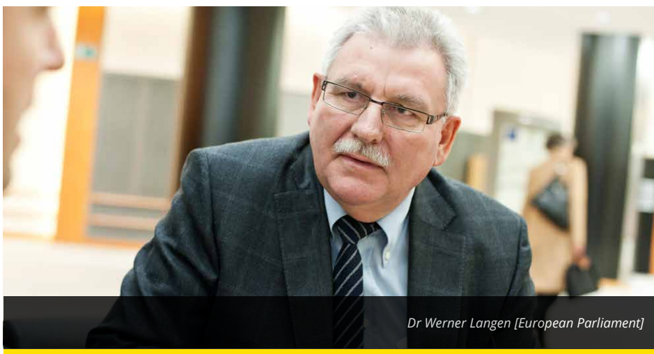
Dr Werner Langen [European Parliament]

The ASEAN-Delegation of the European Parliament will visit Thailand in May 2016. The resolution from last year will be guidance for our meetings with the Thai authorities. The draft for a new constitution and democratic elections in 2017 will be the benchmark for our relations with Thailand, which has been a pillar of stability in South-East-Asia. Therefore, the EU, as a friend and partner of Thailand, has repeatedly encouraged the Thai government to combat human rights abuse and to achieve a return to a democratic system.