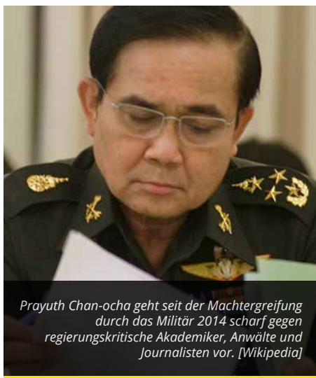
Prayuth Chan-ocha geht seit der Machtergreifung durch das Militär 2014 scharf gegen regierungskritische Akademiker, Anwälte und Journalisten vor. [Wikipedia]

Die meisten Europäer denken bei Thailand an exotische Früchte und lange Strände. Für die Thailänder selbst, aber auch für immer mehr westliche Diplomaten, Akademiker und Juristen gilt das Land als „Polizeistaat“. EurActiv Brüssel berichtet.