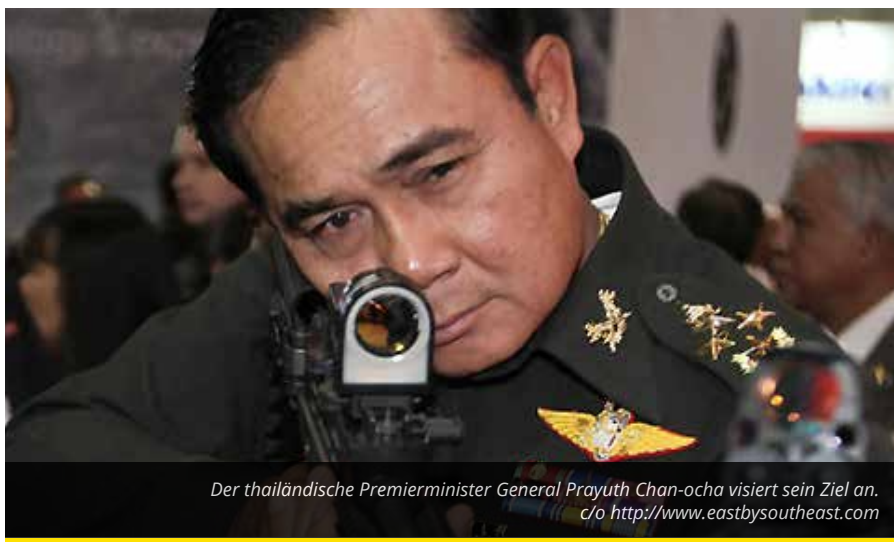
Der thailändische Premierminister General Prayuth Chan-ocha visiert sein Ziel an.