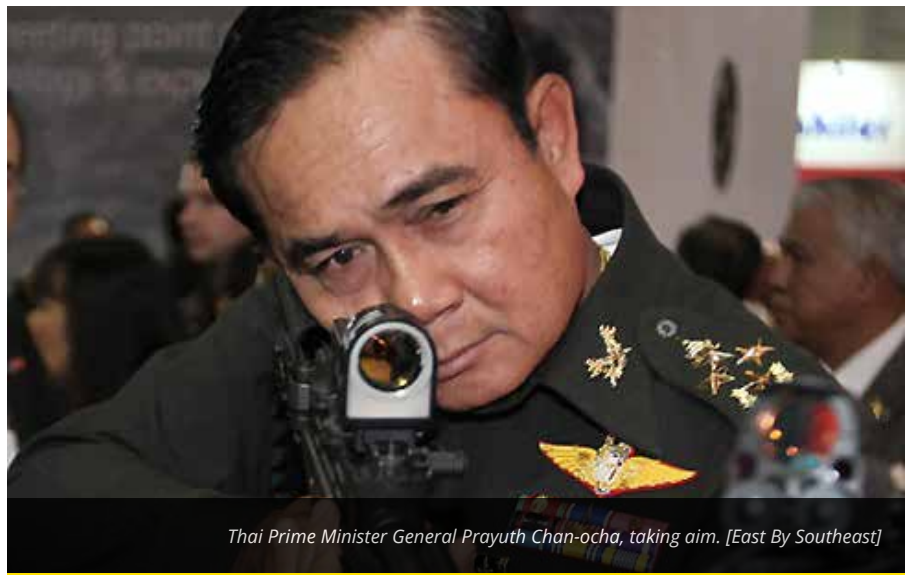
Thai Prime Minister General Prayuth Chan-ocha, taking aim. [East By Southeast]