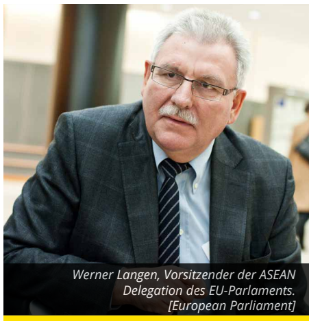
Werner Langen, Vorsitzender der ASEAN Delegation des EU-Parlaments.

Die Beziehungen zwischen der EU und Thailand werden erheblich vom neuen Verfassungsentwurf und den geplanten demokratischen Wahlen 2017 abhängen, erklärt der Europaabgeordnete Werner Langen im Interview mit EurActiv.