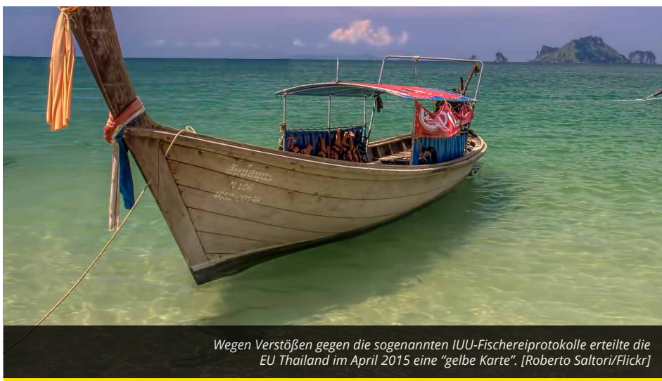
Wegen Verstößen gegen die sogenannten IUU-Fischereiprotokolle erteilte die EU Thailand im April 2015 eine „gelbe Karte“.

So wichtig die Fischereiindustrie für die thailändische Wirtschaft auch ist – die Aussetzung der Verhandlungen über ein Freihandelsabkommen ist für Thailand am schwersten zu verkraften. Nachdem die Hoffnungen auf einen baldiges EU-ASEAN-Freihandelsabkommen schwanden, sah sich die Kommission nach einzelnen ASEAN-Ländern um, mit denen sie die ersten bilateralen Deals abschließen könnte. Man entschied sich für Singapur, Vietnam und Thailand. Singapur habe man gewählt, weil es die offenste, ehrgeizigste und am schnellsten wachsende Volkswirtschaft der ASEAN sei,