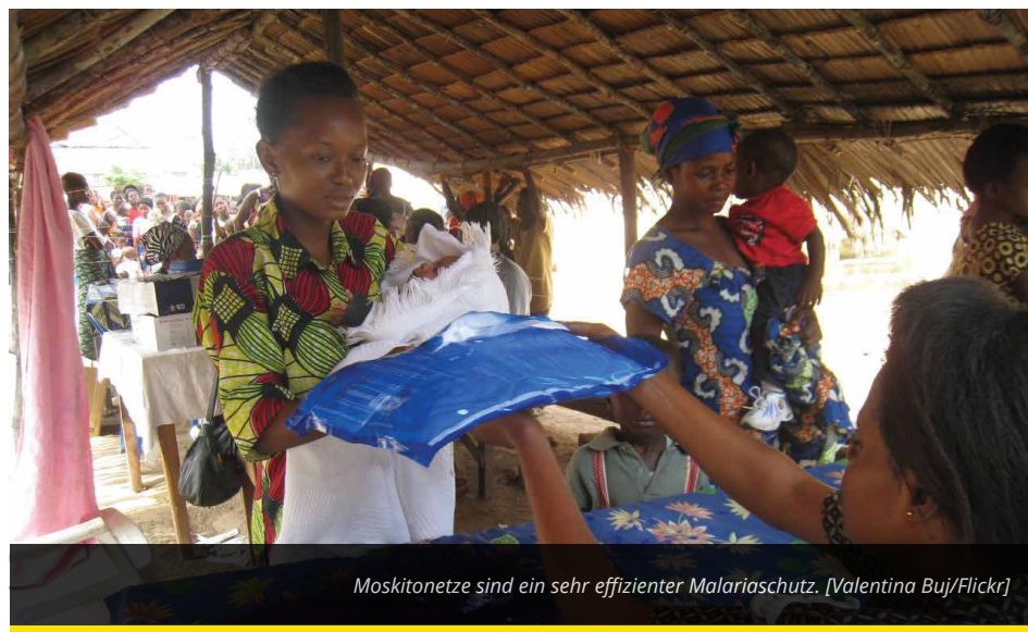
Moskitonetze sind ein sehr effizienter Malariaschutz.

Die Vereinten Nationen beschließen im September eine Liste mit 169 Entwicklungszielen für den Zeitraum bis 2030. Experten warnen jedoch vor einer Überdehnung der Entwicklungshilfeeats. Sie schlagen deshalb alternative Nachhaltigkeitsziele vor. EurActiv Frankreich berichtet.