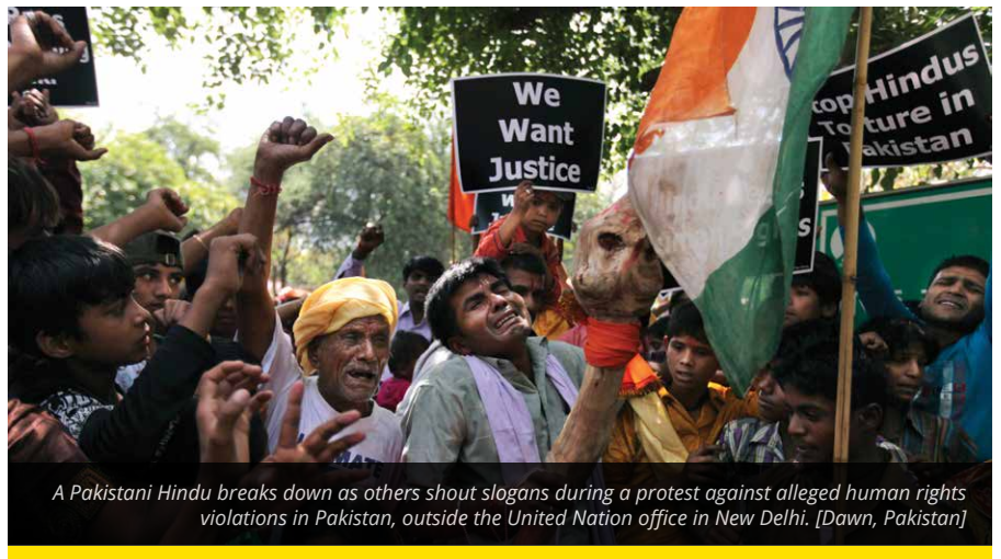
A Pakistani Hindu breaks down as others shout slogans during a protest against alleged human rights violations in Pakistan, outside the United Nation office in New Delhi.