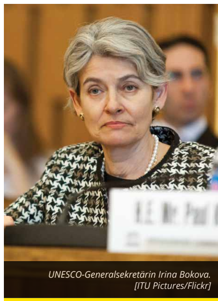
UNESCO-Generalsekretärin Irina Bokova.

Die Agenturen der Vereinten Nationen werden in der Post-2015-Agenda eine noch ausschlaggebendere Rolle spielen als bisher unter den Millenniums-Entwicklungszielen. Denn die