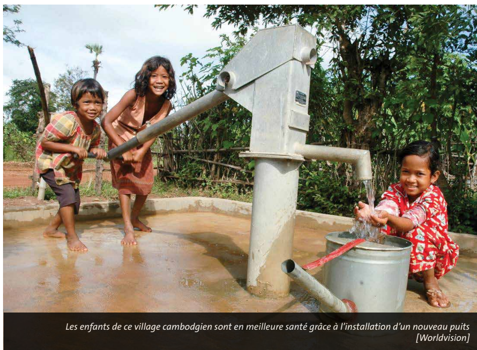
Les enfants de ce village cambodgien sont en meilleure santé grâce à l'installation d'un nouveau puits

« Le cofinancement (privé-public) dans le secteur de l'eau et de l'assainissement peut jouer le rôle de catalyseur pour les nouveaux ODD pour 2030. Il faut construire des alliances stratégiques au sein des gouvernements, de la société civile, du secteur privé, des donateurs, car l'eau potable n'est pas un