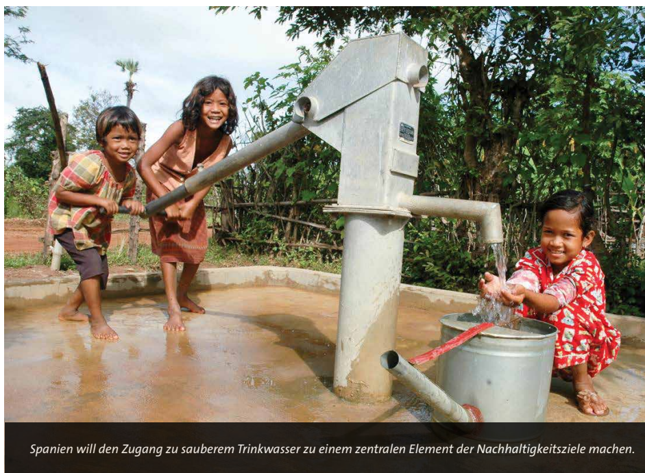
Spanien will den Zugang zu sauberem Trinkwasser zu einem zentralen Element der Nachhaltigkeitsziele machen.

„Wenn es Ihnen ernst mit Dingen wie dem Zugang zu Wasser und