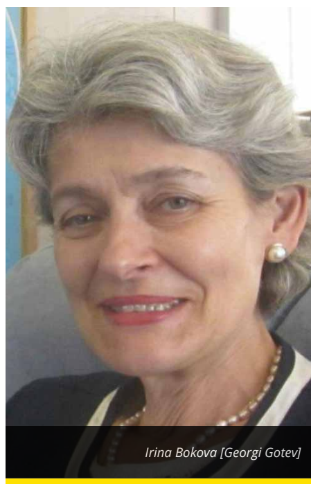
Irina Bokova [Georgi Gotev]

The role of the United Nations specialised agencies becomes more important under the post-2015 agenda, because they are universal, just like the Sustainable Development Goals, UNESCO Director General Irina Bokova, told EurActiv in an exclusive interview.