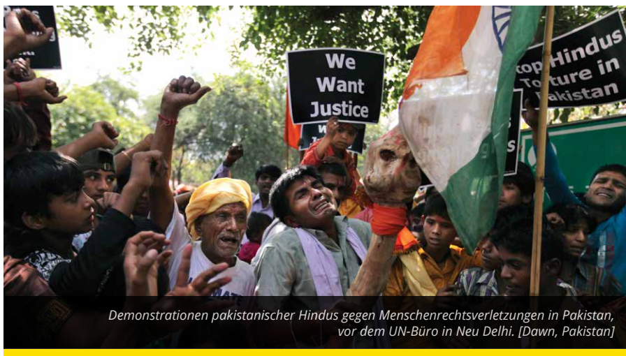
Demonstrationen pakistanischer Hindus gegen Menschenrechtsverletzungen in Pakistan, vor dem UN-Büro in Neu Delhi.