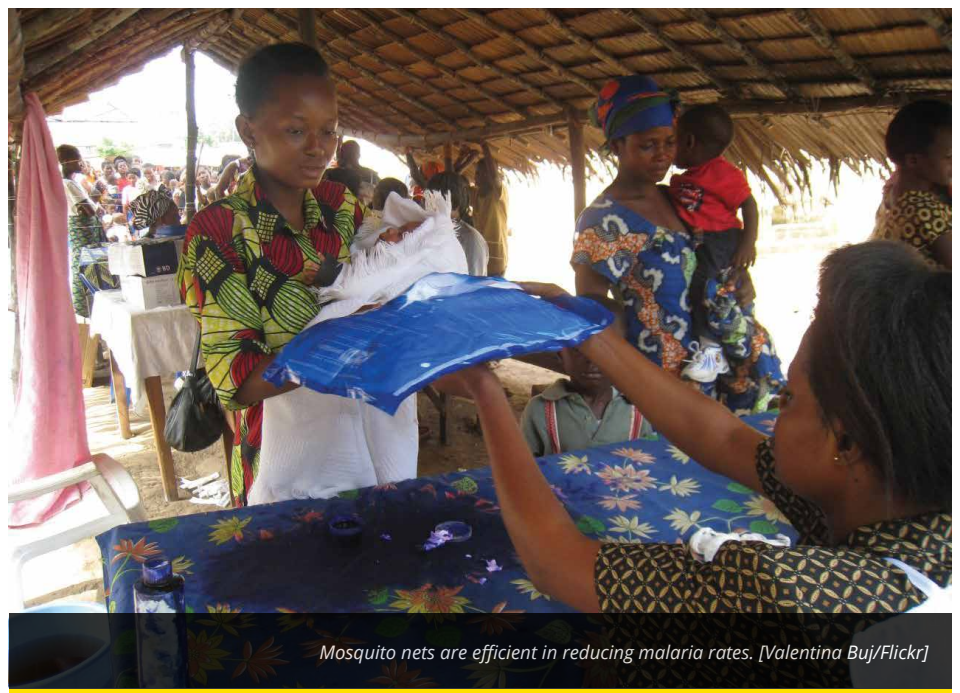
Mosquito nets are efficient in reducing malaria rates.

Sceptical of the extremely broad scope of the SDGs, the Copenhagen Consensus Centre, in partnership with