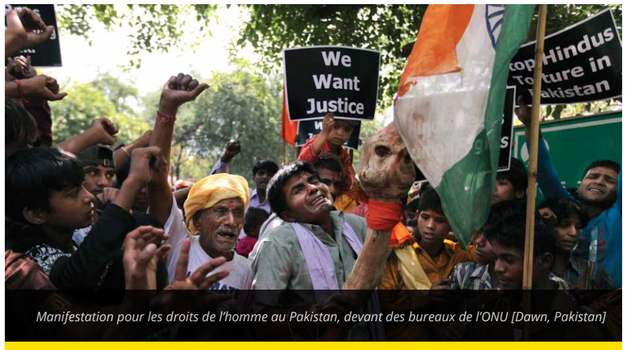
Manifestation pour les droits de l'homme au Pakistan, devant des bureaux de l'ONU [Dawn, Pakistan]